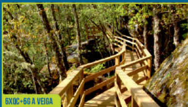
6XDC+6G A VEIGA