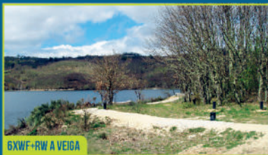
6XWF+RW A VEIGA