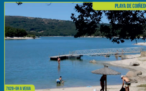
PLAYA DE COÑEDO