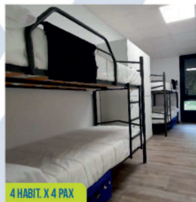
4 HABIT. X 4 PAX