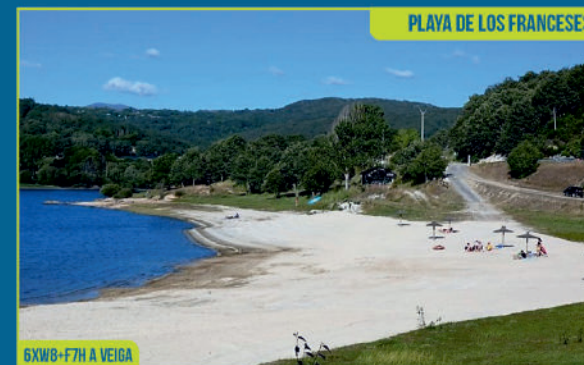
PLAYA DE LOS FRANCESSES