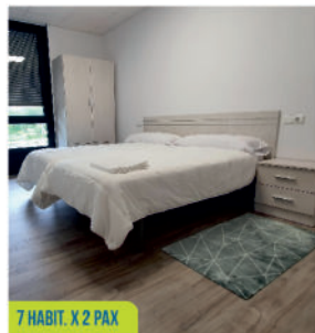
7 HABIT. X 2 PAX