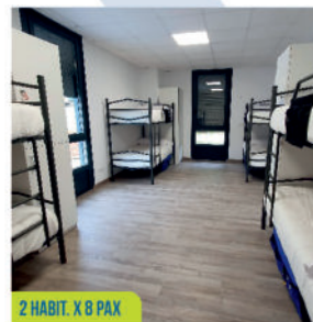
2 HABIT. X 8 PAX