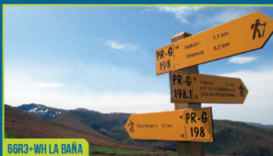
6GR3+WH LA BAÑA

> PR-G-199. RUTA DE PEÑA TREVINCA POLO ALTO > PR-G-198. RUTA PICO MALURO-PEÑA TREVINCA > PR-G-201. RUTA SERRA CALVA-PEÑA TREVINCA > Y OTRAS RUTAS HOMOLOGADAS